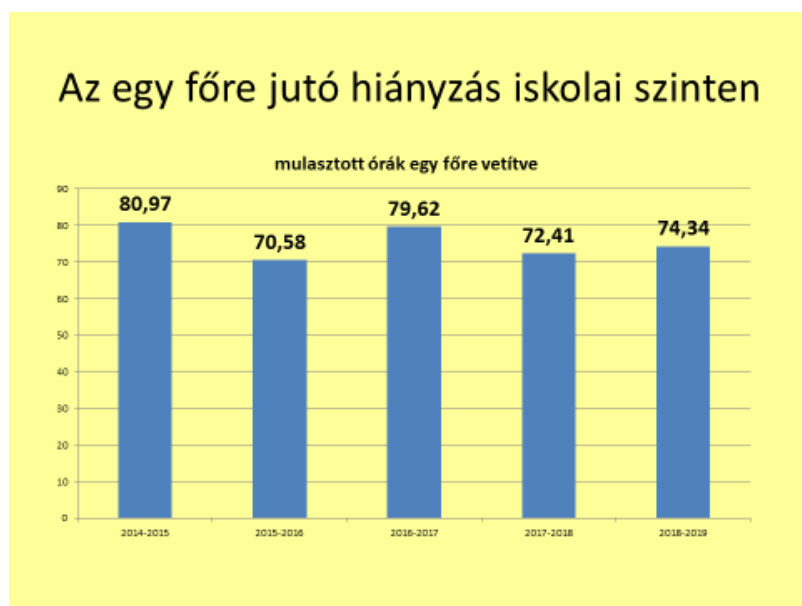
6. ábra Egy főre jutó hiányzás az elmúlt öt tanévben

A hiányzások és a lemorzsolódás között szoros összefüggés van, mert a hiányzó tanulóknak nehézséget okoz a mulasztott órákon vett tananyag megtanulása, a felhalmozódó feladatok pótlása. Ész érvekkel igyekszünk a diákokat meggyőzni a tanórai jelenlét fontosságáról.