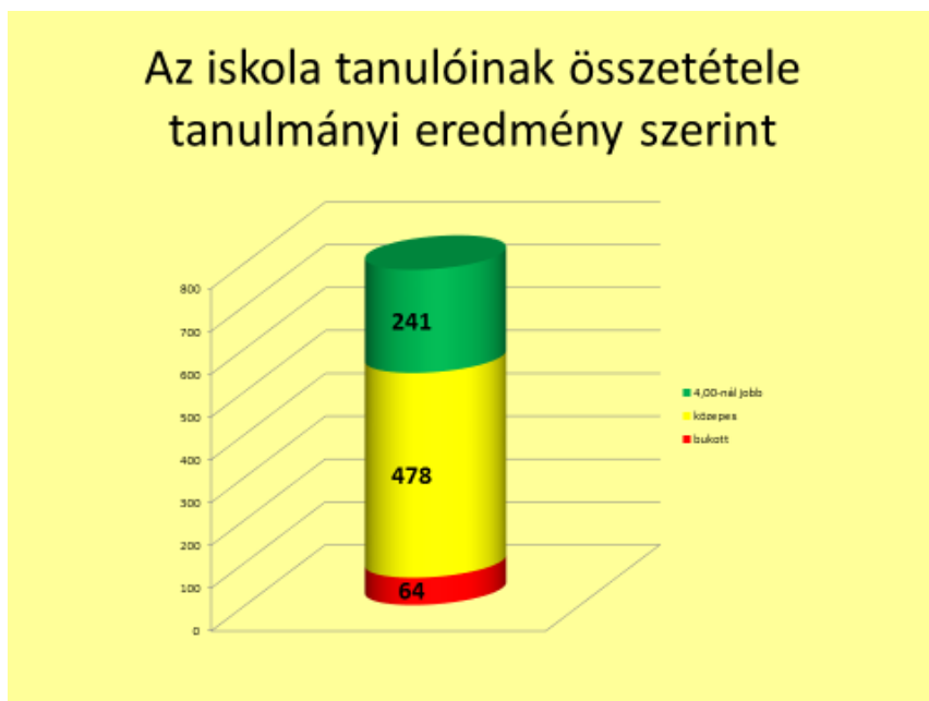
1. ábra A tanulók tanulmányi eredménye a 2017/18-as tanévben