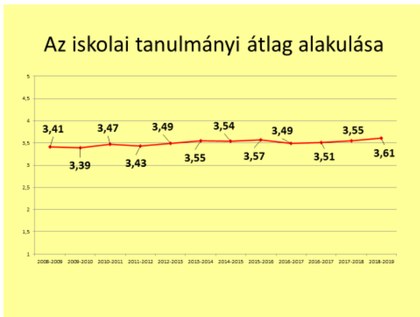
1. ábra Az iskolai tanulmányi átlag az elmúlt 10 évben