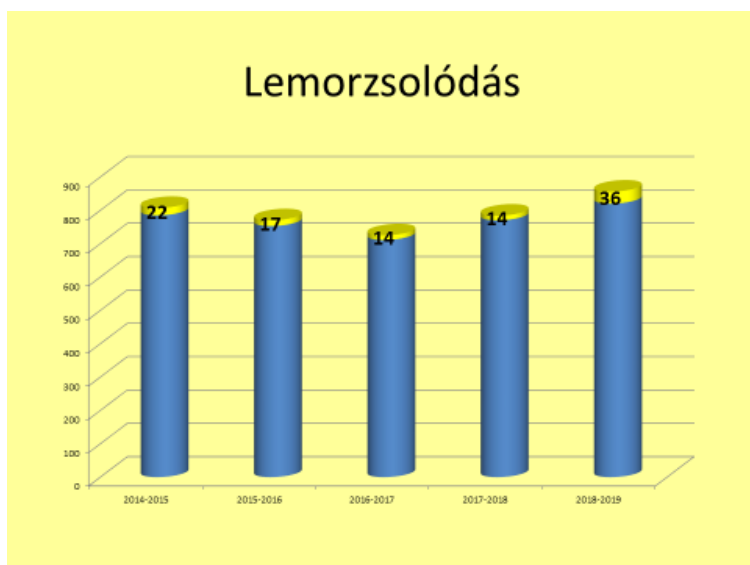
5. ábra Lemorzsolódás az elmúlt öt évben